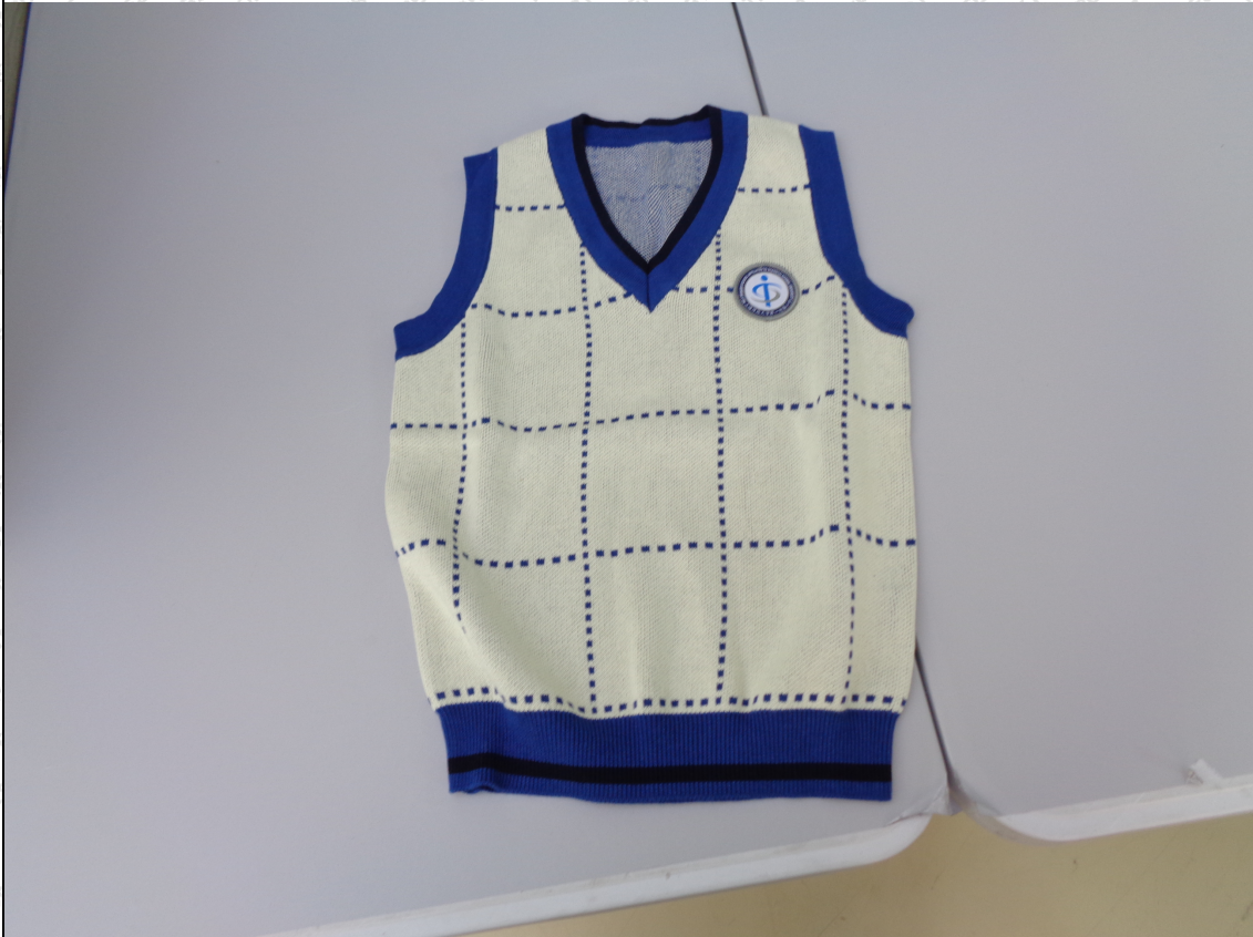
米白拼蓝条针织背心