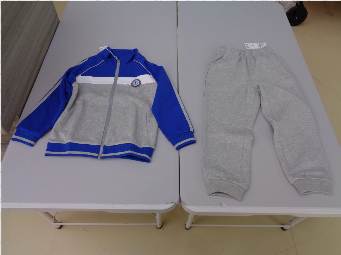
蓝拼灰色上衣；灰色长裤